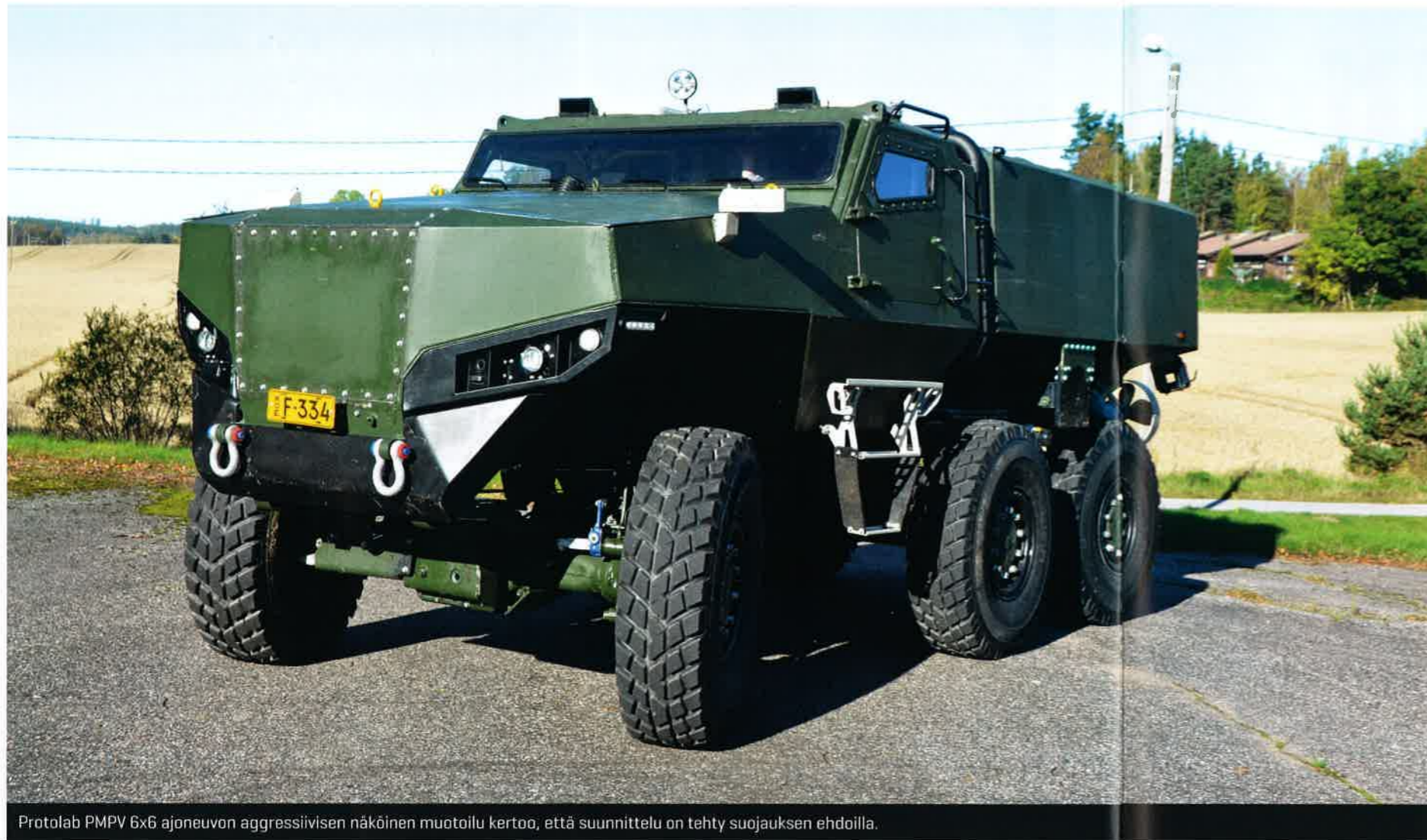
Protolab PMPV 6x6 ajoneuvon aggressiivisen näköinen muotoilu kertoo, että suunnittelu on tehty suojauksen ehdoilla.